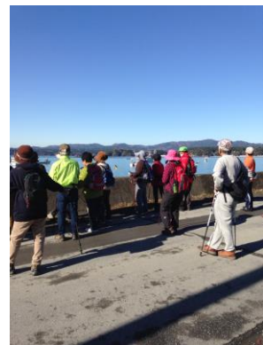
11/19 南三陸町歌津地区