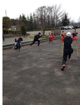
11/20 富岡町体験会（郡山富田復興住宅にお住まいの方々）