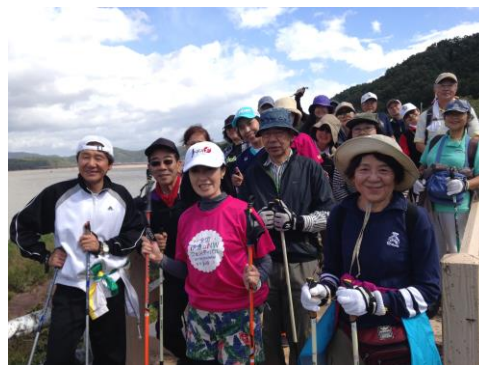
5/30、10/3 岩手県御所湖NW体験会