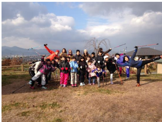
山形市寺子屋塾（福島からの避難者家族対象）12/25（金）