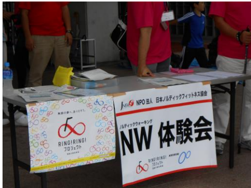
7/5 福島県双葉郡7か町村主催「ノルディックウォーキング講習会・交流会」