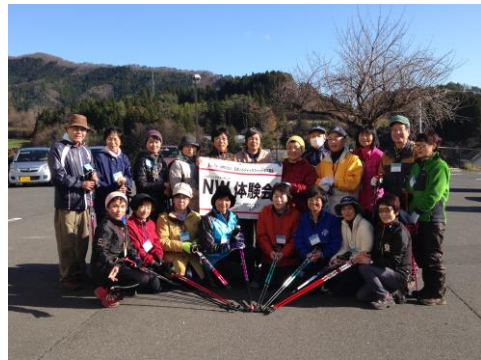
12/5 南三陸町入谷地区