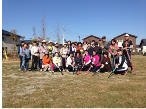
11/5、12 岩沼市玉浦西地区